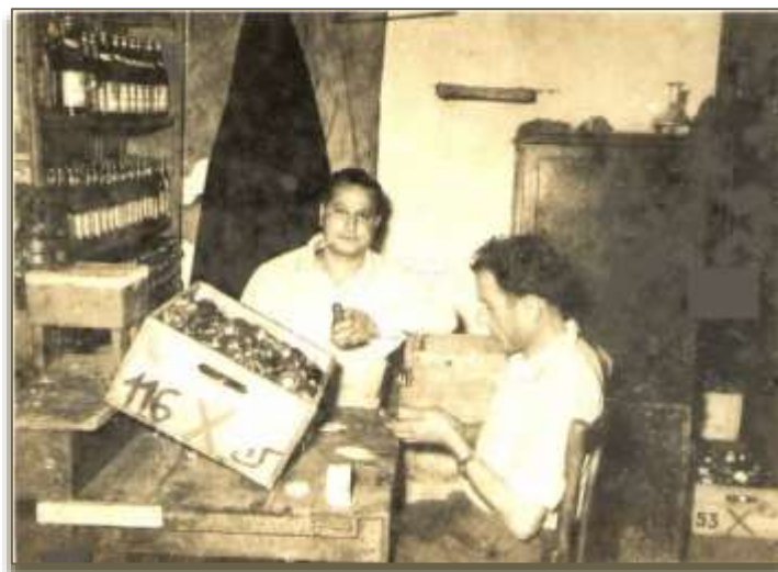
Collage des étiquettes Années 1940-1950, Ca. 1950

ensuite étiquetées pour être mises dans des caisses en bois et destinées à être vendues dans les différentes régions libanaises ou exportées.