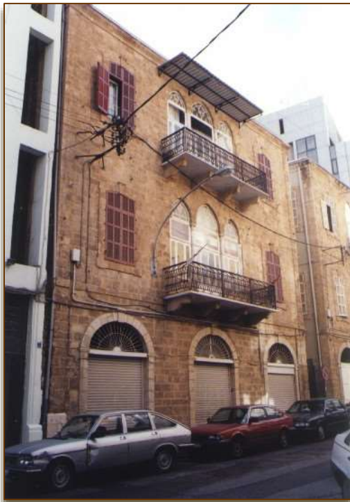
Site de la première entreprise, Photo prise en 1996

Avec la participation de Boutros, et à la suite de la mort prématurée de son frère en 1927, l'effectif de l'entreprise va progressivement s'accroître au début des années 1930 ce qui va amener Boutros Kazan à changer de local en 1934. Le nouveau site, situé à 200 mètres plus loin du premier, était composé de deux parties distinctes, chacune