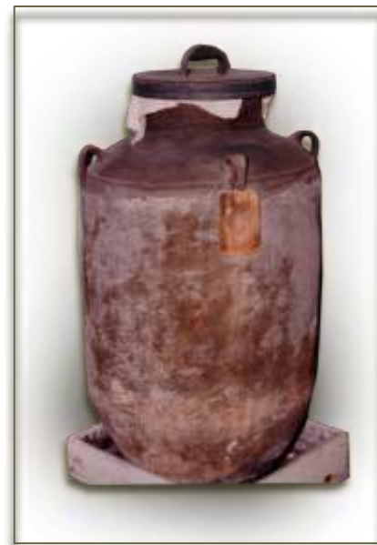
Jarre datant de 1923. Sur l'étiquette on peut lire Girgi Kazan .

L'alcool de raisin nécessaire à la fabrication de l'arak et du brandy provenait notamment des bouilleurs de cru de Zahlé, Jdita et Niha. La Distillerie fournissait à certains bouilleurs de cru les sous-produits (raisin) pour fabriquer l'alcool commandé par l'entreprise. Toutefois la troisième distillation (avec adjonction d'anis) se faisait à la distillerie. L'entreprise achetait aussi des vins (rouge, blanc et doux) desquels on fabriquait aussi les vinaigres et qui provenait des mêmes régions susmentionnées alors que les fournisseurs d'eau de rose et d'eau de fleur