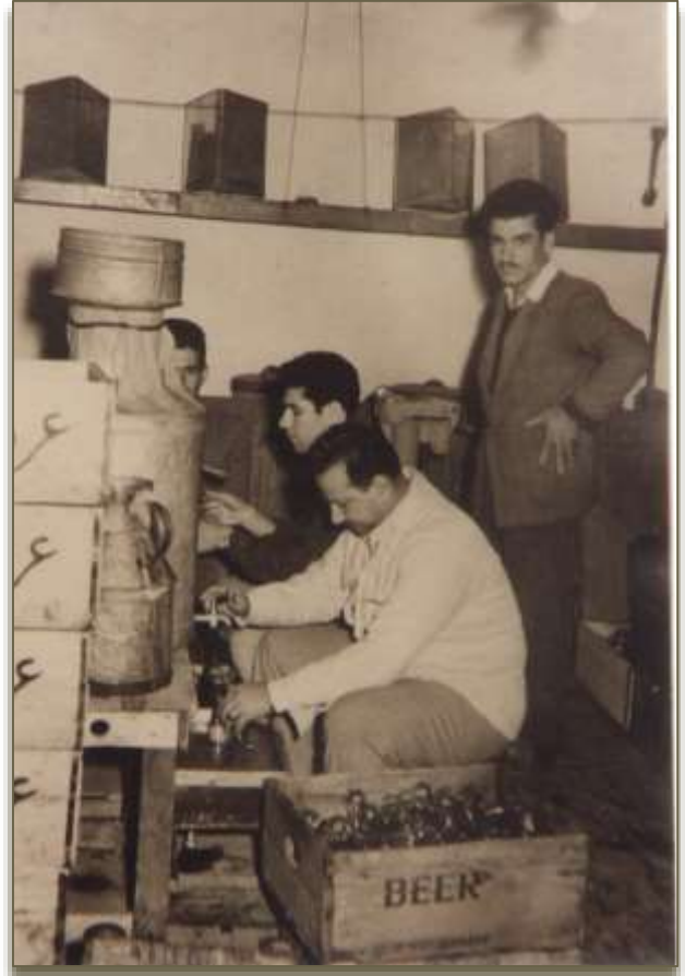
Remplissage des bouteilles - Années 1940-1950, Ca. 1950

utilisé comme combustible, on employât dès lors, pour attiser le feu, des ventilateurs qui en outre enlevaient les séquelles du Mazout (fumée et tâches noires). La distillation se faisait à partir d'appareils distillatoires simples discontinus non munis d'un chauffe-vin. On sait que l'alambic le plus simple comprend une chaudière, ou cucurbite dans laquelle on introduit le liquide à distiller. Cette chaudière ou