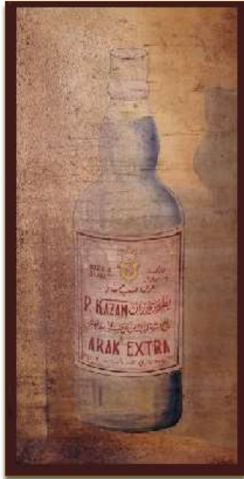
Enseigne de la Distillerie, 1935

Le travail commençait à 7 heures et se terminait à 19 heures avec une heure et demie de pause pour le déjeuner. C'est-à-dire de l'aube au crépuscule, soit douze heures de travail. Le